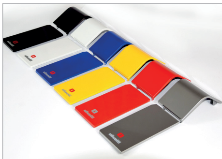
Design moderno e look personalizzabile