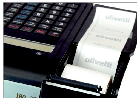
Inserimento rapido e agevole del rotolo carta